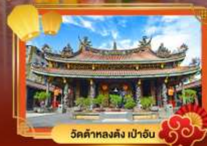
วัดต้าหลงตั้ง เป่าอัน