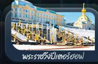
พระราชวังปีเตอร์ฮอฟ