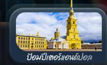
ป้อมปีเตอร์แอนด์ปอล