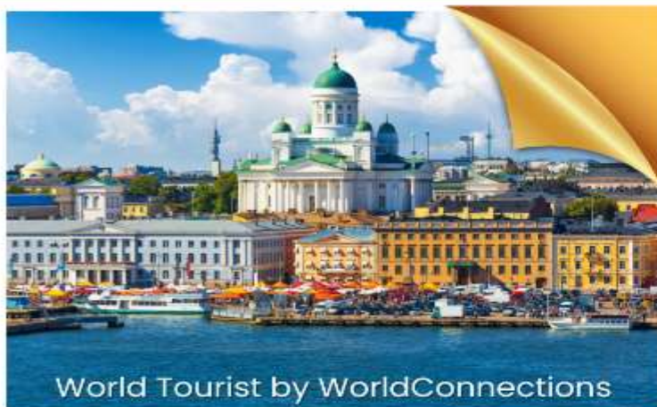
World Tourist by WorldConnections