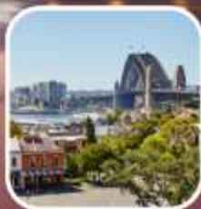
SYDNEY OBSERVATORY HILL