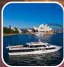
ห้องเรือชมอ่าวซิดนีย์