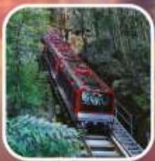
อุทยานบลูเมาท์เท็นส์