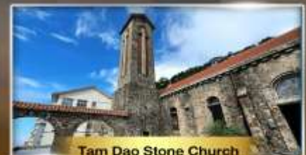
Tam Dao Stone Church