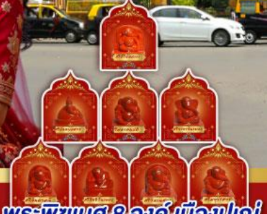
พระพิฆเนศ 8 องค์ เมืองปูณ