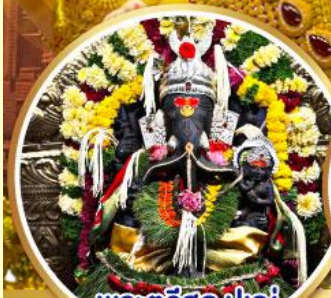
พระตรีศูล ปูณ (Trishul Pune)