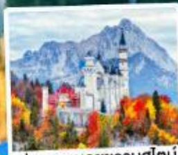
ปราสาทน้อยชวานสไตน์

09-15, 12-18 เม.ย. 69 26 เม.ย.-02 พ.ค. 69 29 เม.ย.-05 พ.ค. / 30 เม.ย.-06 พ.ค. 69 02-08 พ.ค. / 24-30 มิ.ย. 69 02-08, 16-22 ก.ย. 69