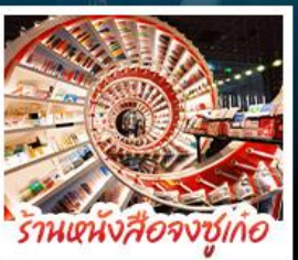
ร้านหนังสือจตุรัสจูไห่