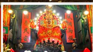
วัดแซกทงหมิว