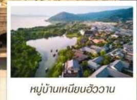
หมู่บ้านเหนียนฮิววาน