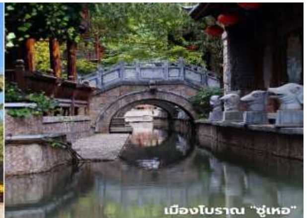
เมืองโบราณ "ซูเหอ"