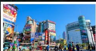
ซ้อปิ้งซีเหมินตึง