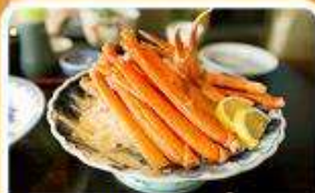
พิเศษ! ชาปู