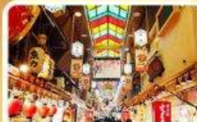
ตลาดปลาชิชิ