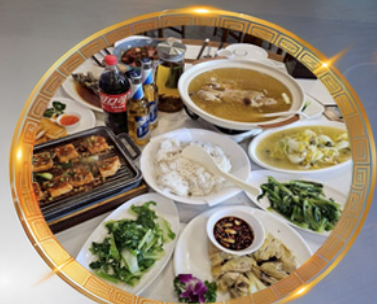
โต๊ะจีนลงชิง เมนูต้นตำรับ รสจัดจ้านแท้ๆ