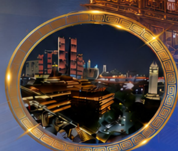
มือตำราอาหารวิวหลักล้าน ชมแสงสีเมืองลงชิง