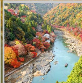
"ARASHIYAMA MT. KAMEYAMA"