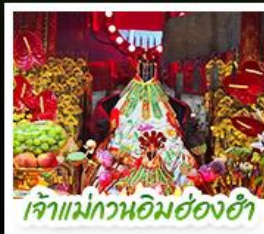
เจ้าแม่ทวนอิมฮ่องฮ่า