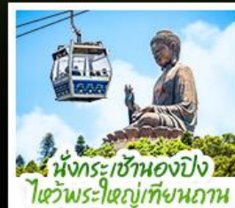
เน็กระเซาเองปิง ไหว้พระใหญ่เทียนถาน