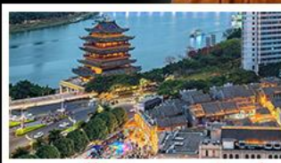
ถนนคนเดินสามตรอกสองซอย