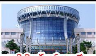
พิพิธภัณฑ์ทิวาสี

สวนสนุก FANTASYLAND - หมู่บ้านสไตล์ยุโรป พิพิธภัณฑ์ทิวาสี - ถนนคนเดินสามตรอกสองซอย ท่าเรือกิ่งจ้อ - ศาลเจ้าแม่กวนอิมพันกร เมนูพิเศษ อาหารทิวาสี , สุกีชาบูหม่าล่า