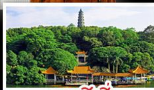
ภูเขาชิงชิว