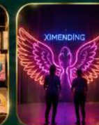
จุดเช็คอินสุดฮิต