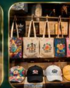
ของฝากเก๋ ๆ