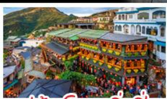
หมู่บ้านโบราณจิ่วเฟิ่น