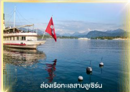
ล่องเรือทะเลสาบลูซิิร์น