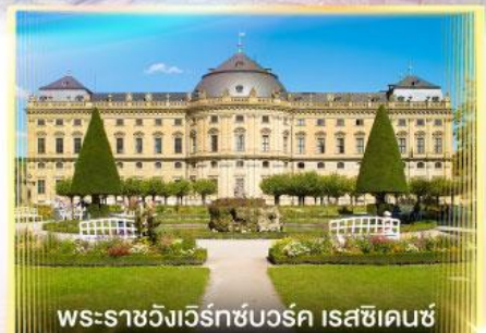
พระราชวังแวร์ซายส์ ไรชชิ่งเฮาส์