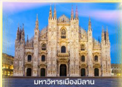
มหาวิหารเมืองมิลาน