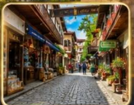
เดินเล่นย่านเมืองเก่าบรรยากาศย้อนยุค