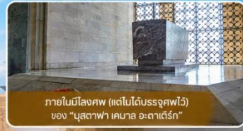
ภายในมีสิ่งศพ (แต่ไม่ได้นำศพไว้) ของ "มุสตาฟา เคมาล อะตาเติร์ก"