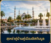
สุเหร่าบ้านคูเมืองอิสตันบูล