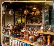
เลือกซื้อของฝากงานหัตถกรรมพื้นเมือง