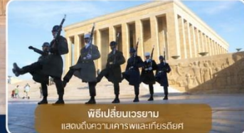
พิธีเปลี่ยนเวรยาม แสดงให้เห็นเคารพและเกียรติยศ