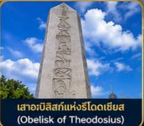
เสาอเบลิสก์แห่งโรโดเดียม (Obelisk of Theodosius)