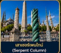
เสาฮอร์เพนไทน์ (Serpent Column)