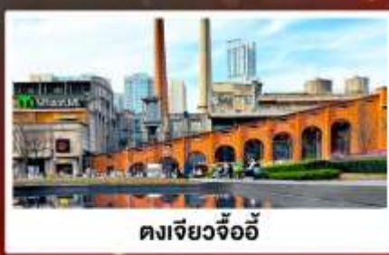
ตงเจียวจ้ออ