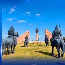
สวนสาธารณะจงกิลฮ่าน