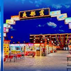
ตลาดกลางคืน ตาลาเดออี