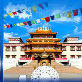
วัดพระโพธิสัตว์ อูลาน