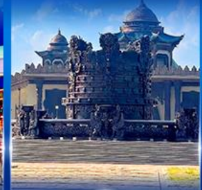
ศูนย์วัฒนธรรม มองโกเลีย หยวนหลิว