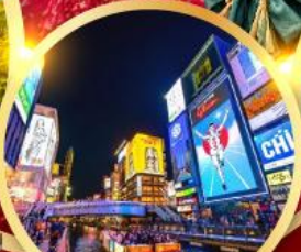
ช้อปปิ้งชินโซบาช