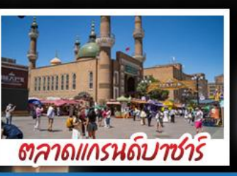
ตลาดแกรนด์บาซาร์