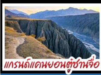
แกรนด์แคนยอนตุ่ซ่านจื่อ

ทะเลสาบไซโหล่มู่ - คานาสือ แกรนด์แคนยอนตุ่ซ่านจื่อ ตลาดแกรนด์บาซาร์ - หมู่บ้านหอมู่