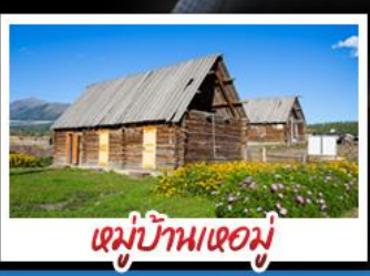
หมู่บ้านหอมู่