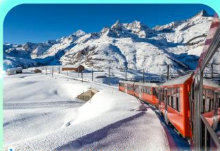
นั่งรถไฟสู่ยอดเขารอนเนอร์เกรต

สวยสะท้านฟ้าที่สวิสฯ สะกิดรักที่โดม พีชิตาแมทเทอร์ฮอร์นและจุงเฟรา