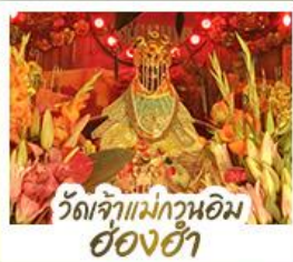
่วดเจ้าแม่กวนอิมอ่่งอ่่า