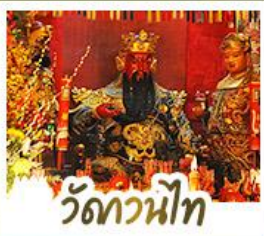
่วดกวนน้้ไท