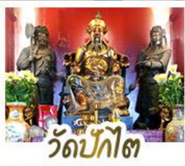
่วดป้กไต่