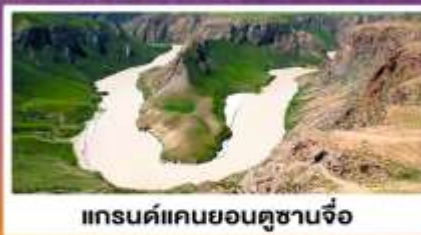
แกรนด์แคนยอนดูซานจื่อ