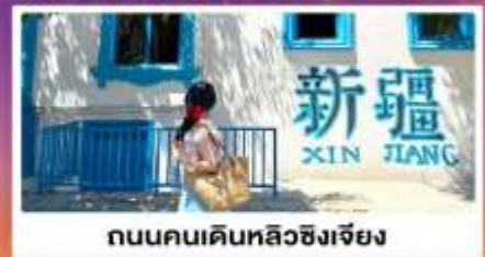
ถนนคนเดินหลิวซิงเจียง