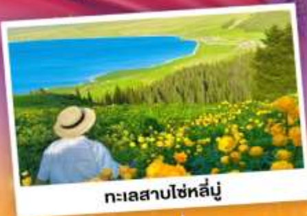
ทะเลสาบไซหลู่