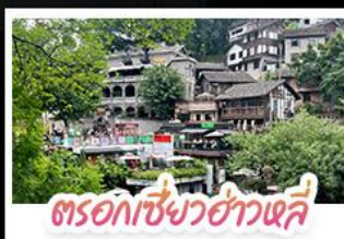
ตรอกเซียวฮ่าวเฉี