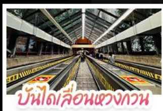
บันไดเลื่อนแขวงกวาน