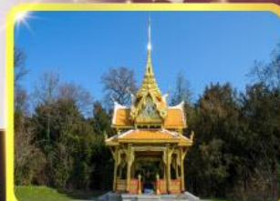
ศาลาไทยไชยาน์