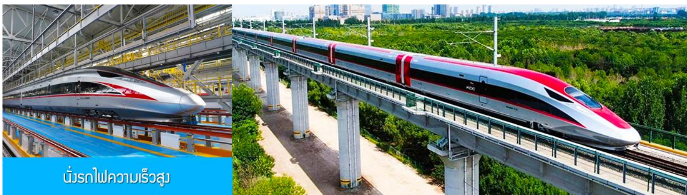
บริการรถไฟความเร็วสูง

14.05 น. นำท่านขึ้นรถไฟความเร็วสูงขบวนที่ G910 (14.05/18.46) เพื่อเดินทางไปยังกรุงปักกิ่ง 18.46 น. ขบวนรถไฟนำท่านเดินทางถึงกรุงปักกิ่ง นำท่านเดินทางโดยรถบัสภัตตาคาร เย็น รับประทานอาหารค่ำ ณ ภัตตาคาร (12) หลังอาหารนำท่านเดินทางสู่ สนามบินต้าชิง กรุงปักกิ่ง ทำการเช็คอิน โหลดสัมภาระก่อนขึ้นเครื่อง