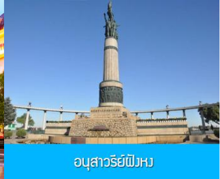
อนุสาวรีย์พิงหว

หลังอาหารนำท่านชม โบสถ์ เซนต์โซเฟีย 索菲亚教堂 (ชมด้านนอก) อีกหนึ่งสัญลักษณ์ที่โดดเด่นของเมืองฮาร์บิน สร้างขึ้นในปี ค.ศ. 1907 เป็น โบสถ์คริสต์นิกายออร์ทอดอกซ์ ที่ใหญ่ที่สุดในเอเชียตะวันออกเฉียง ที่แสดงถึงอิทธิพลของวัฒนธรรมรัสเซียที่มีต่อเมืองฮาร์บิน