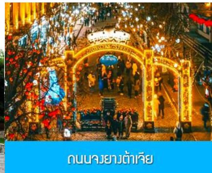
ถนนจางยั้งลู่