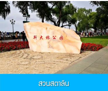
สวนสตาลิน