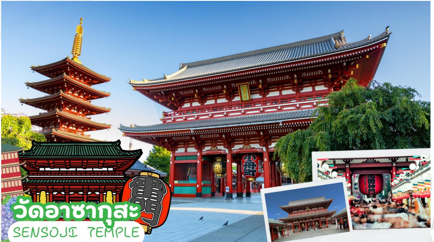
วัดอาซากุสะ SENSOJI TEMPLE

08.10 น. เดินทางถึง สนามบินนาริตะ ประเทศญี่ปุ่น (เวลาท้องถิ่นเร็วกว่าเวลาประเทศไทย 2 ชม.) ผ่านขั้นตอนการตรวจคนเข้าเมือง ด้านศุลกากร และรับกระเป๋าเรียบร้อยแล้ว [สำคัญมาก!! ไม่อนุญาตให้นำอาหารสด จำพวก เนื้อสัตว์ พืช ผัก ผลไม้ เข้าประเทศญี่ปุ่นหากฝ่าฝืนมีโทษปรับได้]