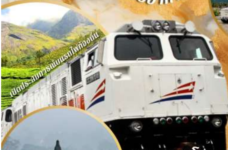
เปิดเส้นทางรถไฟท่องเที่ยว