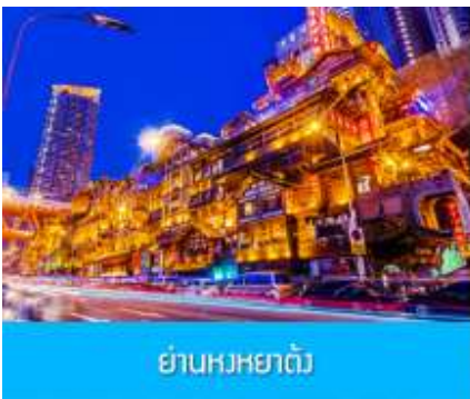
ย่านหงหยาดัง