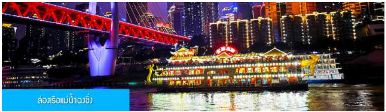
ล่องเรือแม่น้ำหวงซิง

ไกด์นำเสนอ OPTIONAL TOUR แพคเกจล่องเรือ ชมความสวยงามของสองริมฝั่งแม่น้ำเมืองจงซิง + สุกี้หม่าล่าต้นตำหรับ ท่านละ 280 หยวน หรือประมาณ 1,400 บาท