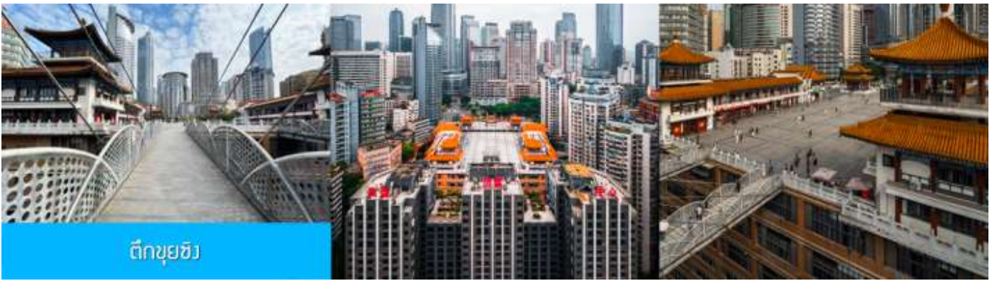
ตึกขุยฮิว

นำท่านเที่ยวชมตึกขุยฮิว (Kuixing Building หรือ 魁星楼) ในเขตหยูจง เมืองฉงชิ่ง เป็นแลนด์มาร์กสุดล้ำที่สะท้อนความเป็น "เมือง 3 มิติ" ได้ดีที่สุดในไฮโลทคือสะพานลอยฟ้าเชื่อมตึกที่ชั้น 22 แต่ระดับพื้นดินที่เดินเข้าจากฝั่งหนึ่งกลับกลายเป็นชั้น 1 ทันที ทำให้มองเห็นวิวตึกและเมืองด้านล่างลึกลงมาก เข้าชมฟรีได้ตลอด 24 ชั่วโมง จากนั้นนำท่านชมตึกที่มีมุมมองอย่างไร ก็คือถนนบนตึก ถนนบนชั้น 22 กุยฮิวโหลว ให้ท่านได้เก็บความสูง และ ความแปลกนี่เป็นที่ระลึก จนได้เวลาอันสมควร