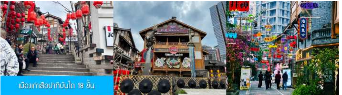
เมืองเก่าสี่ปาทิบันได 18 ชั้น

นำท่านเที่ยวชมตึกขุยฮิว (Kuixing Building หรือ 魁星楼) ในเขตหยูจง เมืองฉงชิ่ง เป็นแลนด์มาร์กสุดล้ำที่สะท้อนความเป็น "เมือง 3 มิติ" ได้ดีที่สุดในไฮโลทคือสะพานลอยฟ้าเชื่อมตึกที่ชั้น 22 แต่ระดับพื้นดินที่เดินเข้าจากฝั่งหนึ่งกลับกลายเป็นชั้น 1 ทันที ทำให้มองเห็นวิวตึกและเมืองด้านล่างลึกลงมาก เข้าชมฟรีได้ตลอด 24 ชั่วโมง จากนั้นนำท่านชมตึกที่มีมุมมองอย่างไร ก็คือถนนบนตึก ถนนบนชั้น 22 กุยฮิวโหลว ให้ท่านได้เก็บความสูง และ ความแปลกนี่เป็นที่ระลึก จนได้เวลาอันสมควร