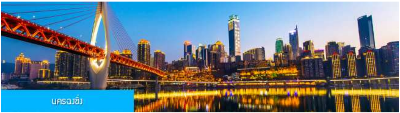
นครฉงชิ่ง