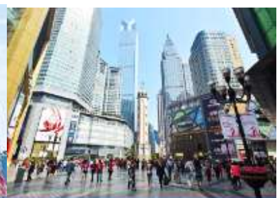
ย่านเรียฟ้าวเปย

เที่ยง รับประทานอาหารกลางวัน ณ ภัตตาคาร (8)