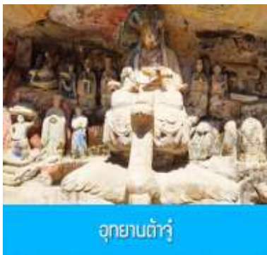
อุทยานต้าจู่

พักที่ HOLIDAY INN EXPRESS HOTEL โรงแรมระดับ 4 ดาว หรือระดับเดียวกัน