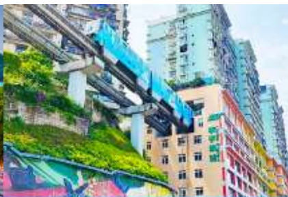
รถไฟวิวกะลุตัก