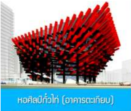
หอศิลป์แก้วไท่ (อาคารตะเกียบ)