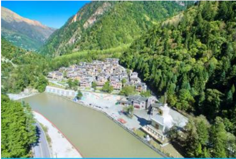
หมู่บ้านทิเบตหยิงหวงฮาเต๋อ

รับประทานอาหารกลางวัน ณ ร้านอาหารพื้นเมือง (8)