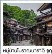
หมู่บ้านโบราณนารายิ จุกุ