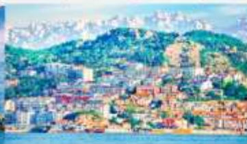
หมู่บ้านชาวประมงซาจื่อโซ่ว