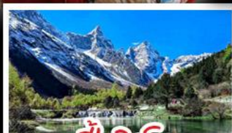
ปี้เฉิงโกว