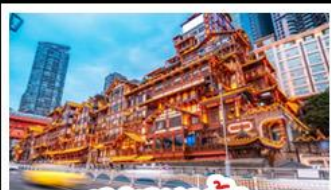
เฉิงเฉิงเฉิง

อุทยานหลุมบ่อฟ้า - อุทยานเจนางฟ้า หงหยาดัง - นังรถไฟทะเลลู่ติ๊ก - อุทยานสีดรุณี ปี้เฉิงโกว - สะพานหนานเฉียว