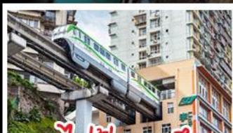
รถไฟไฟทะเลลู่ติ๊ก