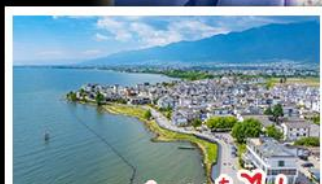
ทะเลสาบเอ๋อไห่