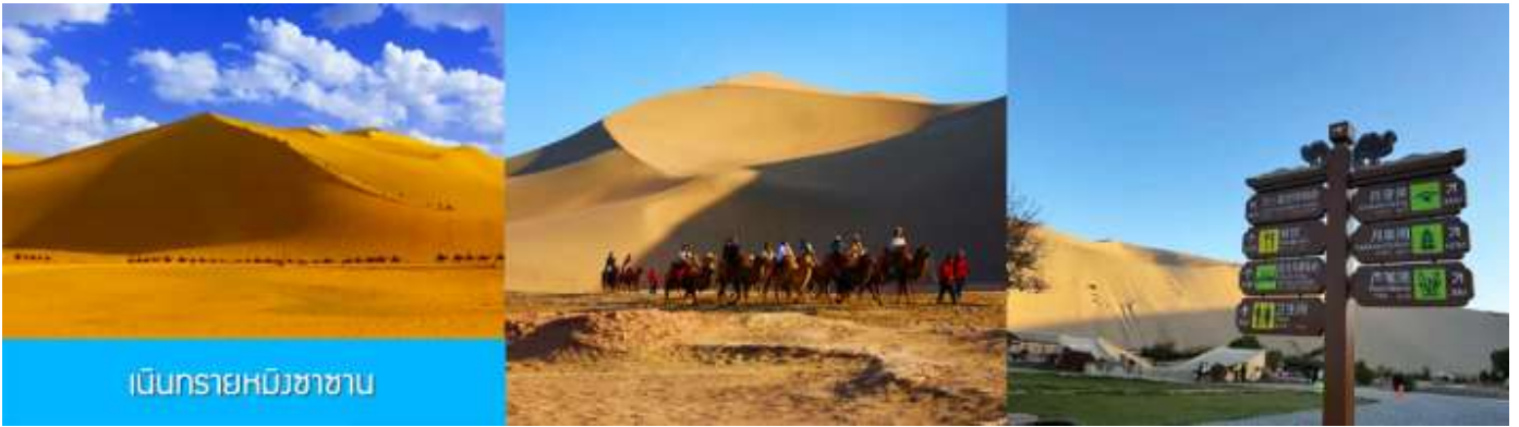
เนินทรายหมิงซาซาน