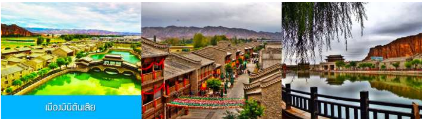
เมืองมินดินสี