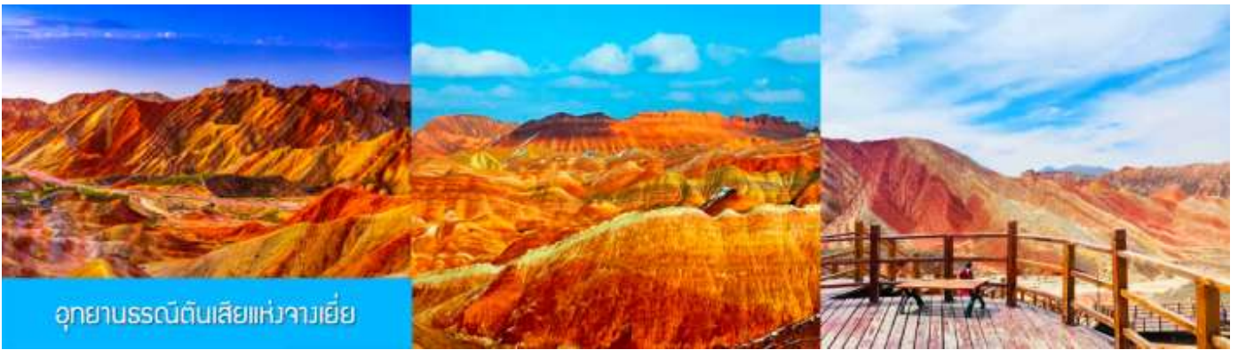
อุทยานธรณีดินสีแห่งจางเยี่ย