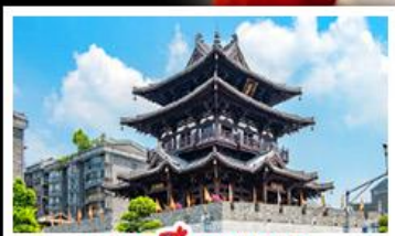
หอเซียวหย่า