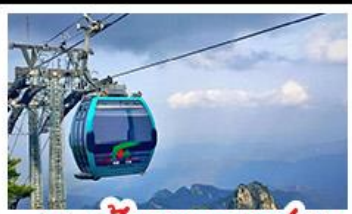
กระเช้าเขาเหยาซาบ