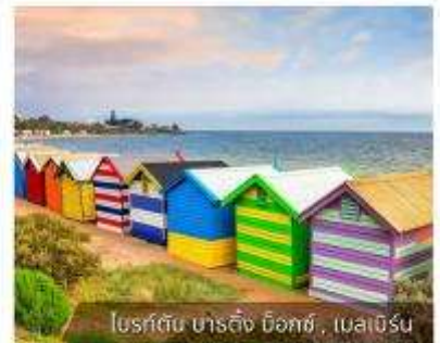
โบสถ์ดิน ชาติถึง ด็อกซ์, เมลเบิร์น