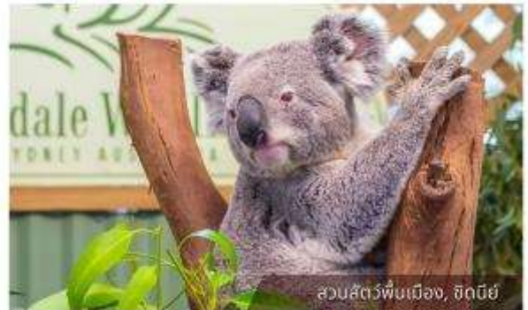
สวนสัตว์พื้นเมือง, ซิดนีย์