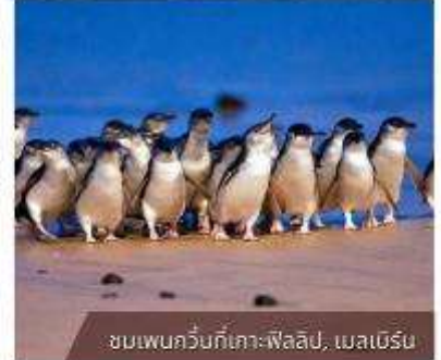
ชมเพนกวินที่เกาะฟิลลิป, เมลเบิร์น