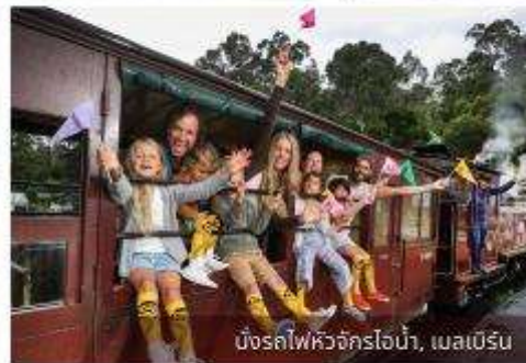
นั่งรถไฟหัวจักรไอน้ำ, เมลเบิร์น