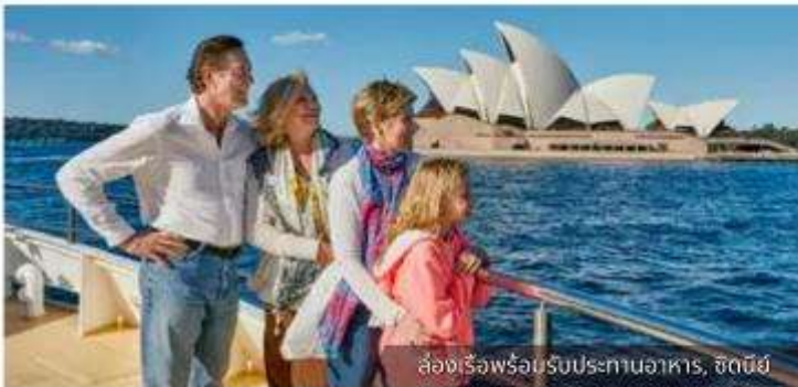
ล่องเรือพร้อมรับประทานอาหาร, ซิดนีย์