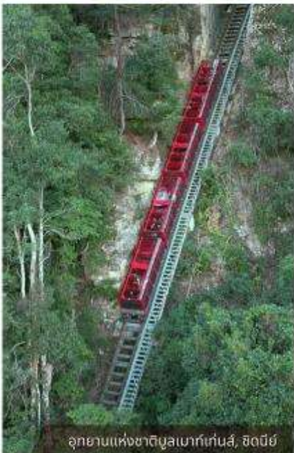
อุทยานแห่งชาติบลูเมาท์เทนส์, ซิดนีย์