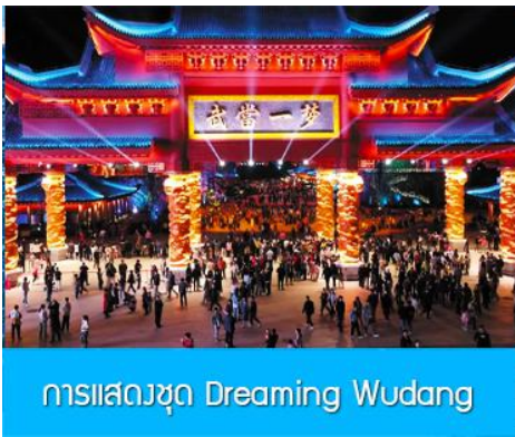
การแสดงชุด Dreaming Wudang