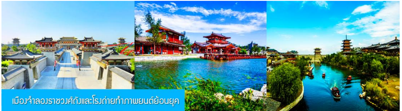
เมืองจำลองราชวงศ์ถังและโรงถ่ายทำภาพยนตร์ย้อนยุค