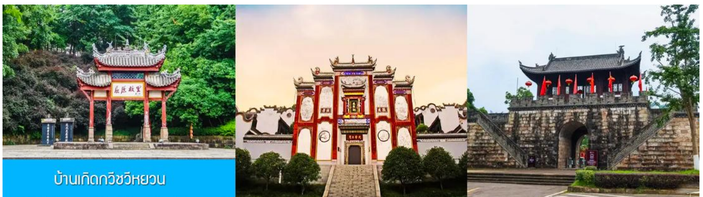
บ้านเกิดกวีชวีหยวน

พักที่ HONG QIAO HOTEL โรงแรมระดับ 4 ดาวหรือเทียบเท่าในเมืองหยีซัง