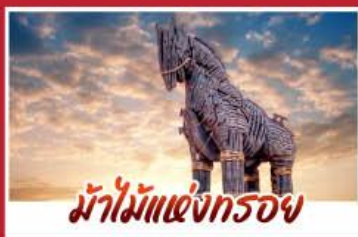
ม้าไม้แห่งกรอย