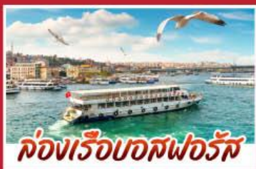
ล่องเรือบอสฟอรัส