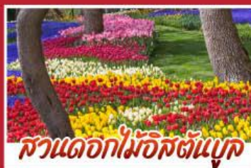
สวนดอกไม้อิสตันบูล