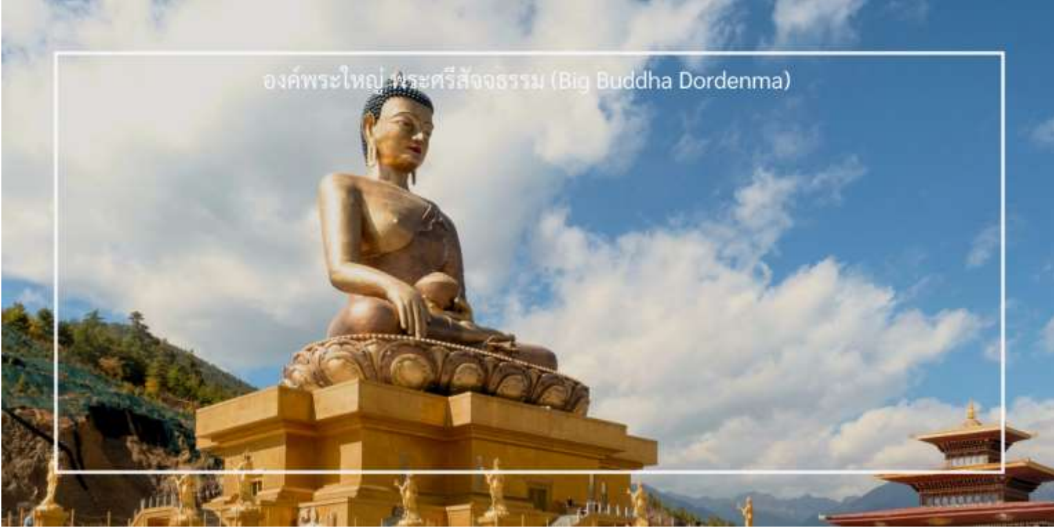
องค์พระใหญ่ พระศรีสัจธรรม (Big Buddha Dordenma)

เที่ยวชม องค์พระใหญ่ พระศรีสัจธรรม (Big Buddha Dordenma) เป็นพระพุทธรูปที่มีความสูงถึง 51 เมตร ตั้งอยู่บนยอดเขาในเมืองทิมพู (Thimphu) ประเทศภูฏาน พระพุทธรูปนี้เป็นหนึ่งในพระพุทธรูปที่ใหญ่ที่สุดในโลก