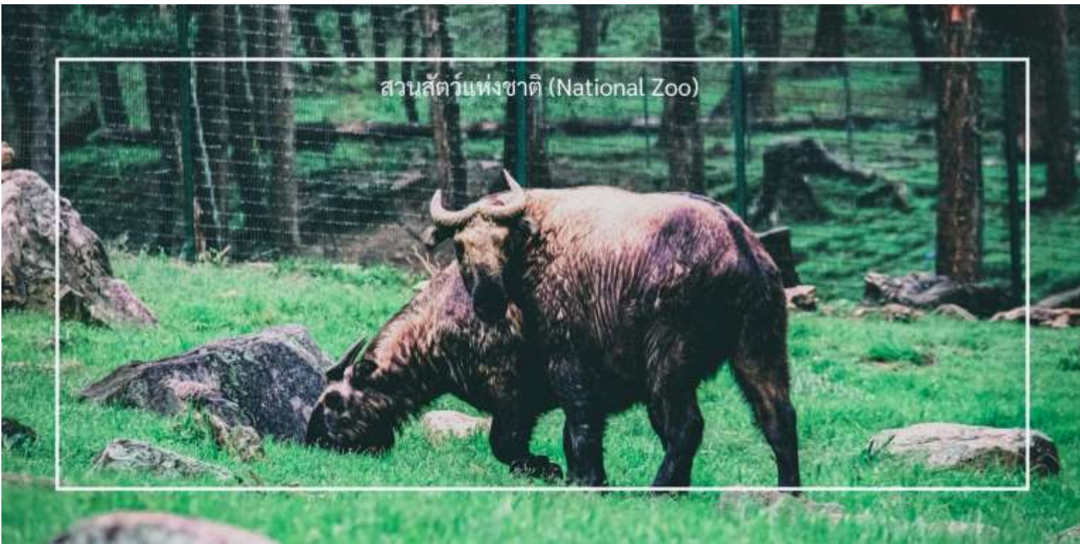
สวนสัตว์แห่งชาติ (National Zoo)

เที่ยวชม จุดชมวิวซังเกกัง (Sangaygang Viewpoint) เป็นหนึ่งในจุดชมวิวที่สวยงามในเมืองทิมพู (Thimphu) ตั้งอยู่บนเนินเขาที่สูง ทำให้ผู้เข้าชมสามารถมองเห็นทิวทัศน์ที่งดงามของเมืองทิมพูและภูเขารอบๆ จุดชมวิวนี้อีกมีทิวทัศน์ที่สวยงามของเมืองทิมพูและเทือกเขาหิมาลัย โดยเฉพาะในวันที่อากาศแจ่มใส นักท่องเที่ยวสามารถเห็นวิวที่กว้างไกลได้อย่างชัดเจน