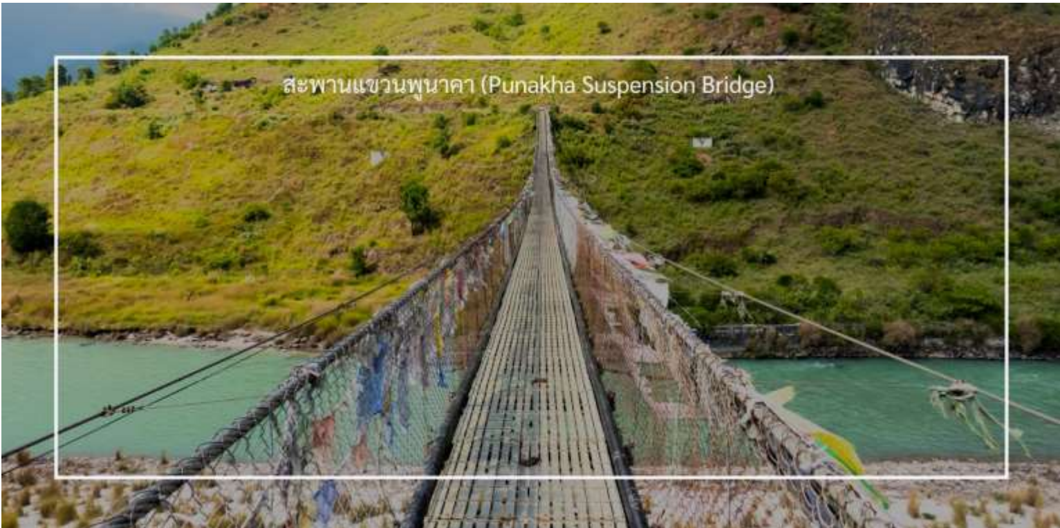
สะพานแขวนพุนาคา (Punakha Suspension Bridge)

เที่ยวชม สะพานแขวนพุนาคา (Punakha Suspension Bridge) เป็นสะพานแขวนที่มีความยาวประมาณ 160 เมตร ตั้งอยู่ใกล้กับป้อมปราการพุนาคาซอง (Punakha Dzong) ในเมืองพุนาคา ประเทศภูฏาน สะพานนี้เป็นหนึ่งในสะพานแขวนที่ยาวที่สุดในภูฏานและเป็นจุดท่องเที่ยวที่น่าสนใจสำหรับนักท่องเที่ยว สะพานแขวนพุนาคามีการออกแบบที่สวยงาม โดยใช้วัสดุที่แข็งแรงและความปลอดภัย ทำให้สามารถเดินข้ามไปยังอีกฝั่งของแม่น้ำได้อย่างสะดวกสบาย เมื่อเดินข้ามสะพาน นักท่องเที่ยวสามารถเพลิดเพลินกับวิวของแม่น้ำโม (Mo Chhu) และภูเขารอบๆ รวมถึงวิวของป้อมปราการพุนาคาซองที่อยู่ใกล้เคียง