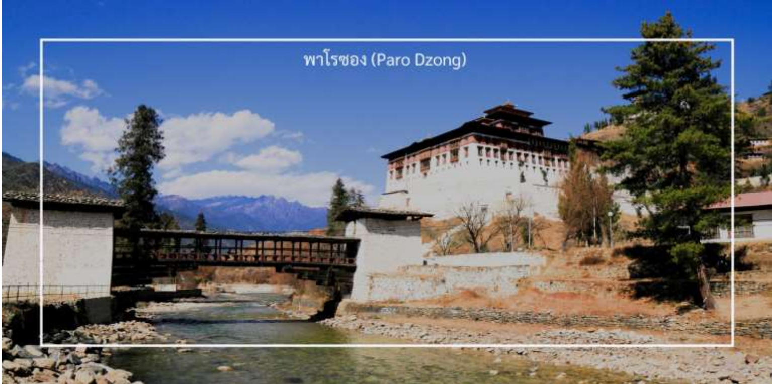
พาโรซอง (Paro Dzong)

เที่ยวชม พาโรซอง (Paro Dzong) เป็นหนึ่งในสถาปัตยกรรมที่สำคัญและสวยงามที่สุดในภูฏาน ตั้งอยู่ในเมืองพาโร (Paro) และมีบทบาทสำคัญทั้งในด้านศาสนาและการปกครอง สร้างขึ้นในปี 1646 เพื่อใช้เป็นที่ทำการของรัฐบาลและวัดประจำเมือง พาโรซองเป็นสัญลักษณ์ของความเข้มแข็งและความเป็นอิสระของภูฏาน