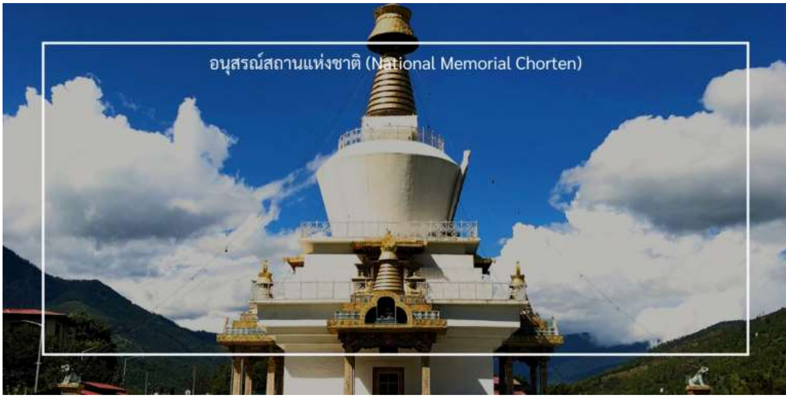
อนุสรณ์สถานแห่งชาติ (National Memorial Chorten)

ออกเดินทางสู่เมืองพูนาคา โดยใช้เวลาเดินทางประมาณ 2.30 ชั่วโมง