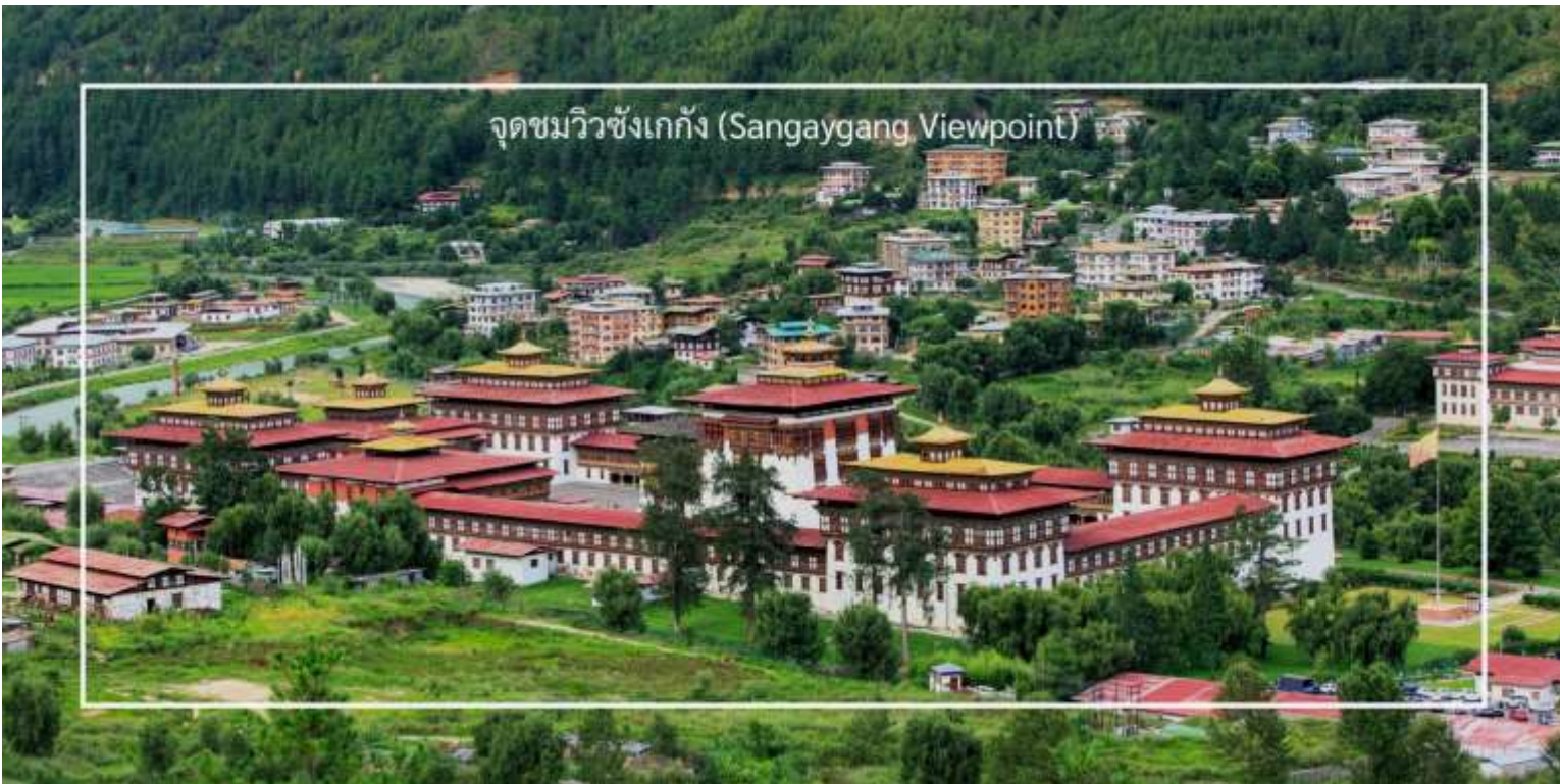
จุดชมวิวซังเกกัง (Sangaygang Viewpoint)

ออกเดินทางสู่เมืองพาโร โดยใช้เวลาเดินทางประมาณ 50 นาที