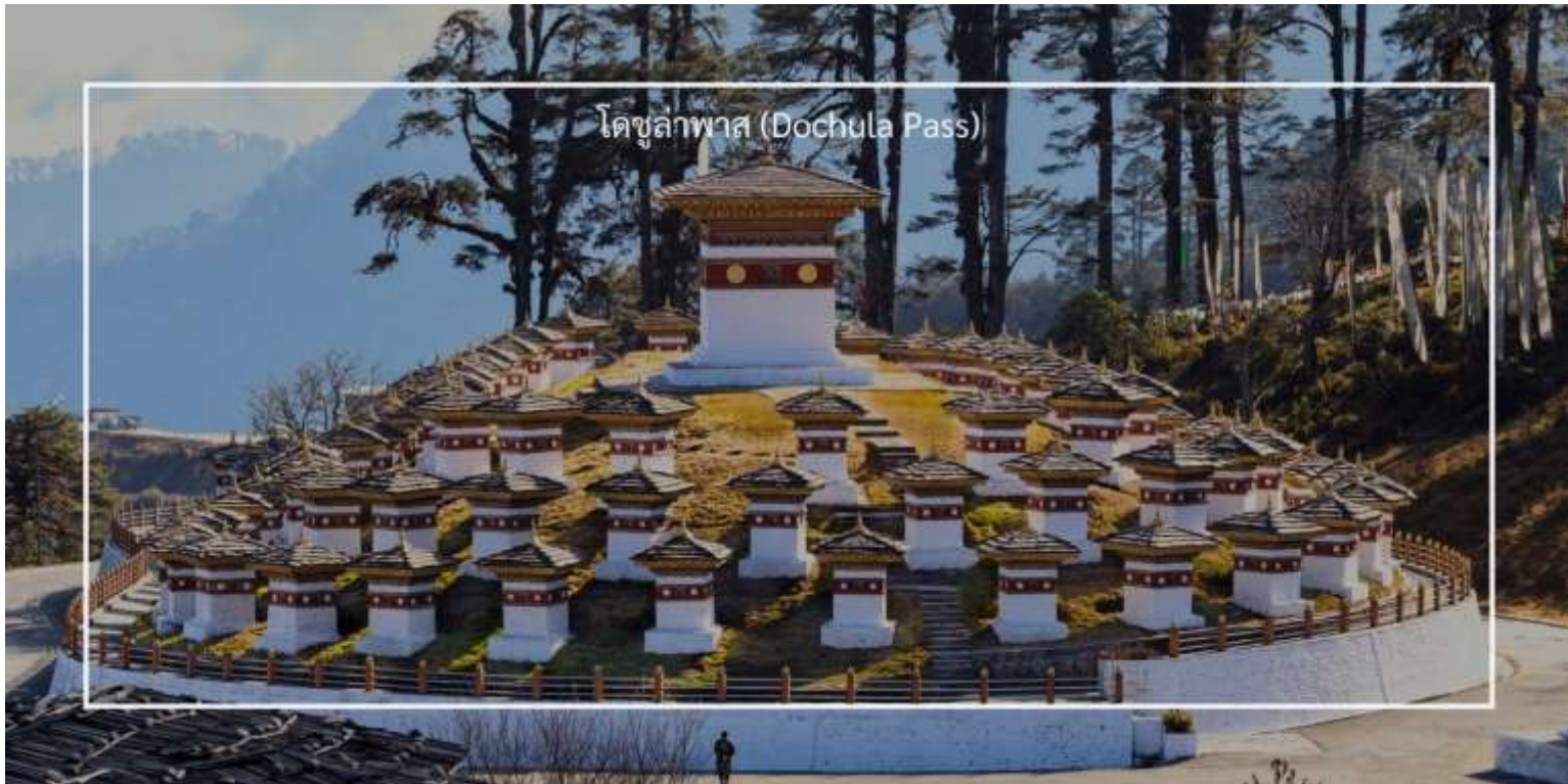
โดจุลาพาส (Dochula Pass)

เที่ยวชม โดจุลาพาส (Dochula Pass) เป็นจุดชมวิวที่สวยงามและมีความสำคัญทางประวัติศาสตร์ ตั้งอยู่บนเส้นทางที่เชื่อมระหว่างเมืองทิมพู และพาโร ที่นี่ยังเป็นจุดที่นักท่องเที่ยวมักจะแวะพักเพื่อชมวิทิวทัศน์ที่งดงามของเทือกเขาหิมาลัย มีวิวที่งดงามของภูเขาหิมาลัย โดยเฉพาะในวันที่อากาศแจ่มใส นักท่องเที่ยวสามารถมองเห็นยอดเขาที่สูงที่สุดในภูมิภาคได้อย่างชัดเจน บริเวณโดจุลาพาสมีการสร้างเจดีย์และสถูปจำนวน 108 องค์ ซึ่งสร้างขึ้นเพื่อเป็นอนุสรณ์แก่พระสงฆ์และผู้เสียชีวิตในการต่อสู้กับผู้รุกรานภูฏานในอดีต