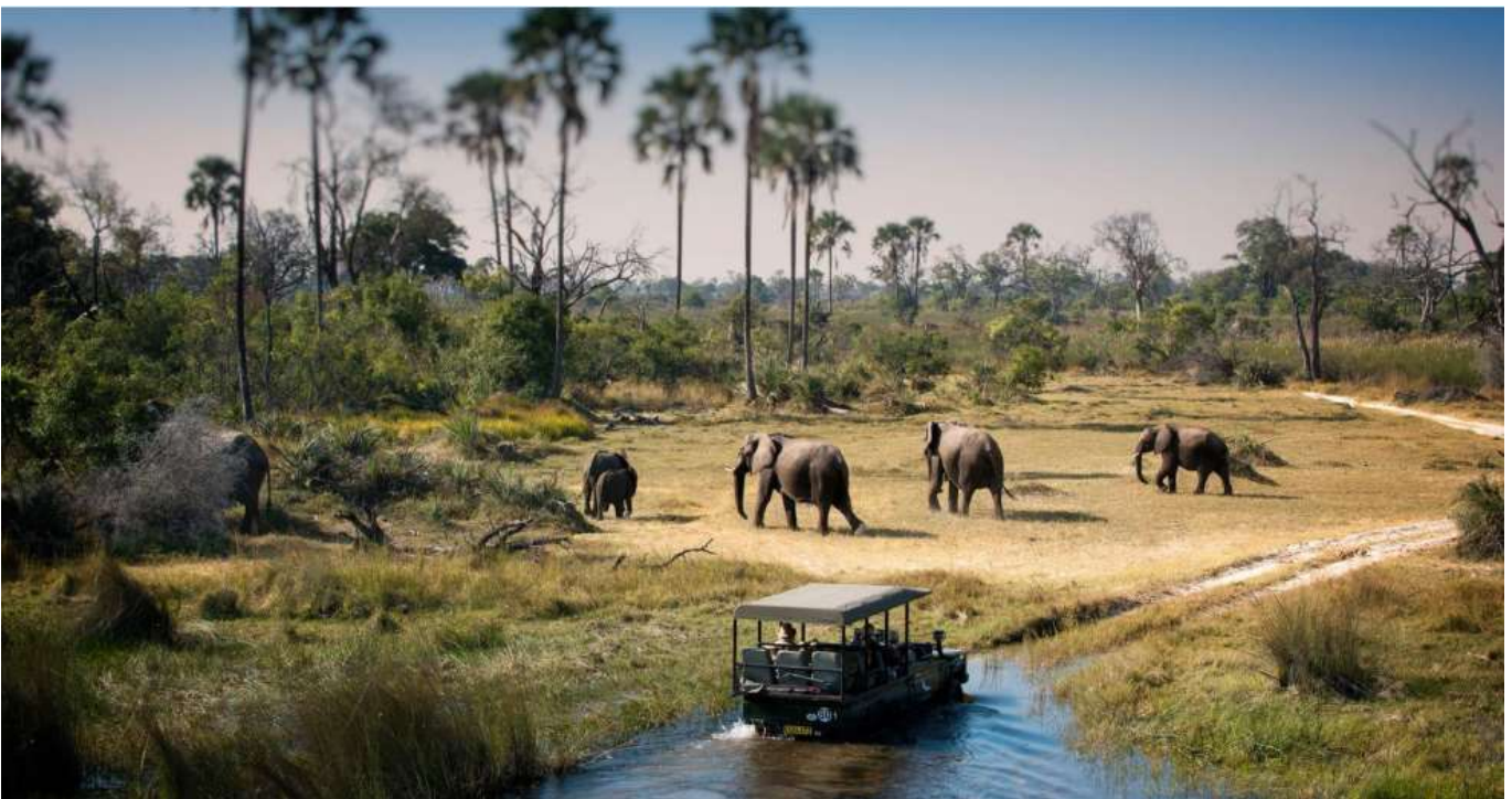
วันหยุดที่ดีที่สุดที่ 6 สิงหาคม 2569 Chobe National Park Botswana - Zambezi Sundowner cruise