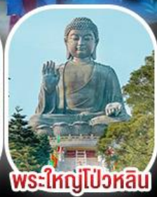
พระใหญ่โป่วหลิน