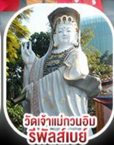
วัดเจ้าแม่กวนอิม รีพัลส์เบย์