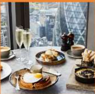
DUCK AND WAFFLE