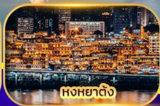
หงหยาดิง