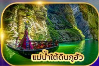
แม่น้ำใต้ดินกุ้ยโจว