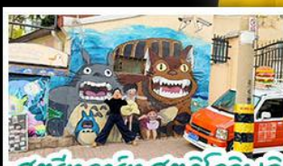
สตรีทอาร์ต สตูดิโอจิบลิ