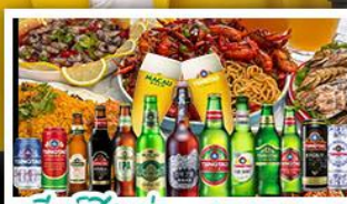
เบียร์ชิงเต่า + อาหารทะเล