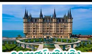
คฤหาสน์เหวินเจิง

เมืองเก่าชิงเต่า - คฤหาสน์เหวินเจิง เบียร์ชิงเต่า + อาหารทะเล สตรีทอาร์ต สตูดิโอจิบลิ