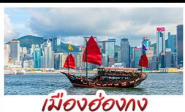
เมืองฮ่อทง