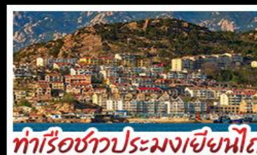
ท่าเรือชาวประมงเยียนโก