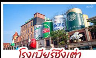
โรงเบียร์ชิงเต่า